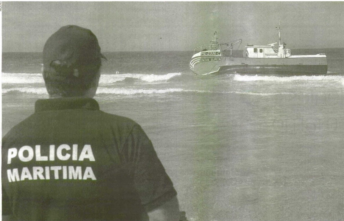
Pescas tiveram um ano terrível, em 2010, com inúmeros naufrágios e mortes de pescadores, mas a forma como a ACT recolhia a informação levou a que nenhum fosse investigado

Encontros, seminários, jornadas, um pouco por todo o país. Este ano, a ACT continua a levar a vários públicos (desde escolas a empresas) a mensagem de que mais vale prevenir do que remediar.